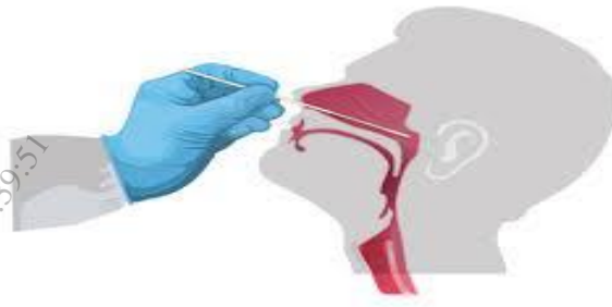
Hình 1: Lấy mẫu ngoáy dịch ty hầu